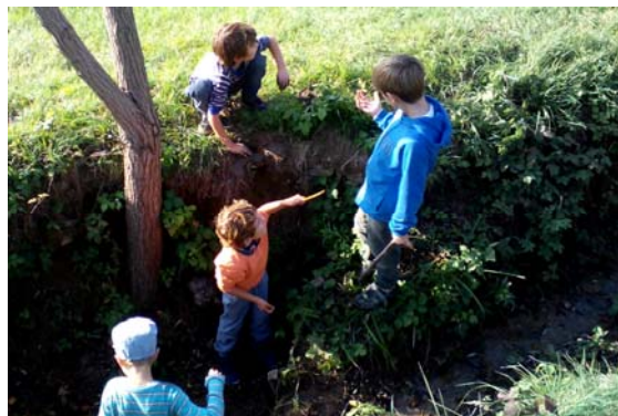
Aktuelles Waldangebot, Oktober 2020

naturAtelier-kv wurde Anfang 2020 gegründet. Die Initiative entstand als Weiterentwicklung unserer Projekte zwischen 2012-2019. Im kleinen Team arbeiten wir mit verlässlichen Partnern zusammen.